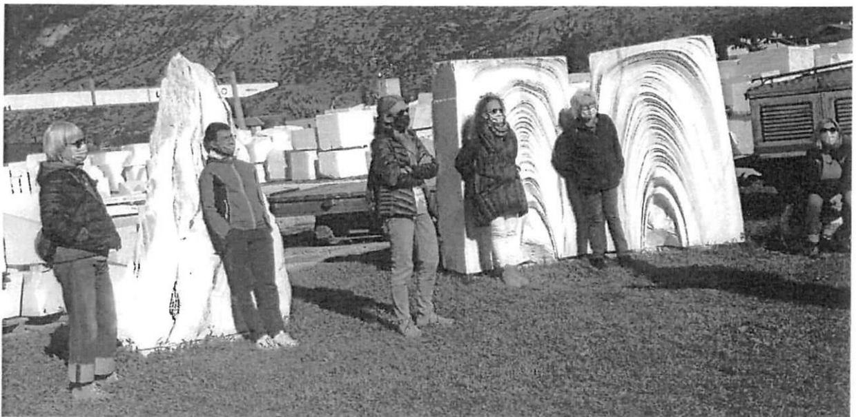
Beim Besuch des Marmorwerks in Laas